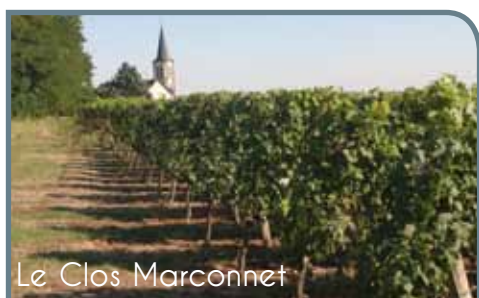
Le Clos Marconnet