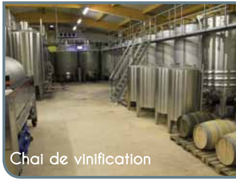
Chai de vinification