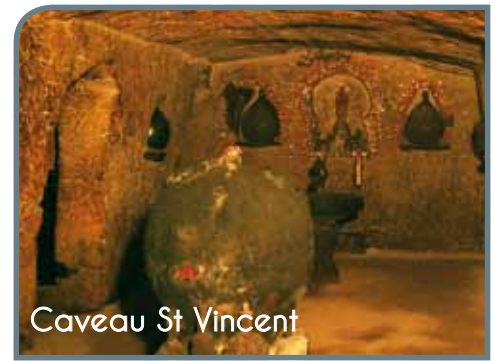
Caveau St Vincent