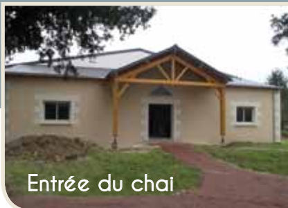
Entrée du chai

Après trois années de travaux, le nouveau chai est désormais opérationnel et l'outil est particulièrement fonctionnel pour travailler. En plus du bâtiment, de lourds investissements ont été réalisés afin d'être plus performants, plus précis dans les vinifications et plus réactifs . Grâce à des subventions du département de Maine et Loire et de l'Europe, nous avons pu faire l'acquisition de matériel moderne (pressoir, thermorégulation, embouteillage...)