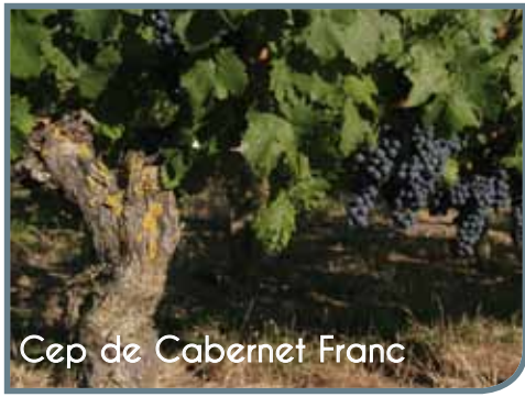
Cep de Cabernet Franc