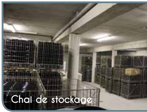
Chai de stockage